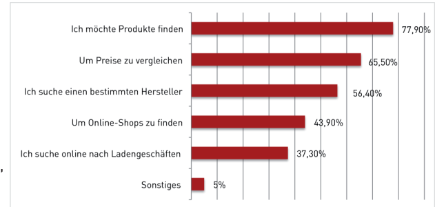
Studie: „Wann nutzen Sie Suchmaschinen?“ (Mehrfachnennung möglich)